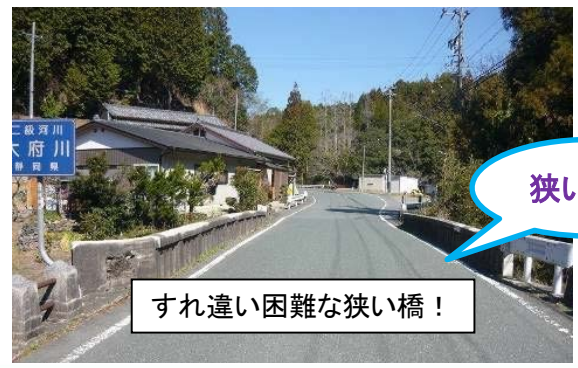
すれ違い困難な狭い橋！